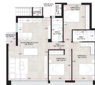
VILLA B (2 dormitorios / 2 baños)