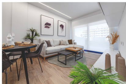
THE IMAGES REFER TO APPROXIMATE SOLUTIONS AND ARE NOT BINDING WITH THE FINAL PROJECT