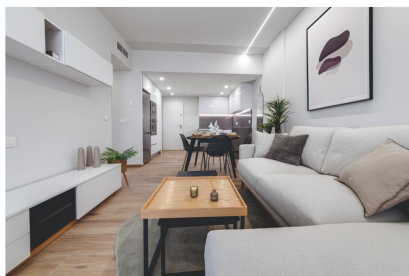
THE IMAGES REFER TO APPROXIMATE SOLUTIONS AND ARE NOT BINDING WITH THE FINAL PROJECT