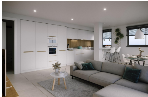
PLANTA PRIMERA / ESCALERA 3 VIVIENDA 1