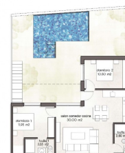
PB / GROUND FL