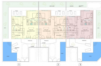
GROUND FLOOR - PLANTA BAJA