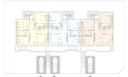
PENTHOUSE - PLANTA ALTA