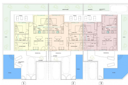
GROUND FLOOR - PLANTA BAJA