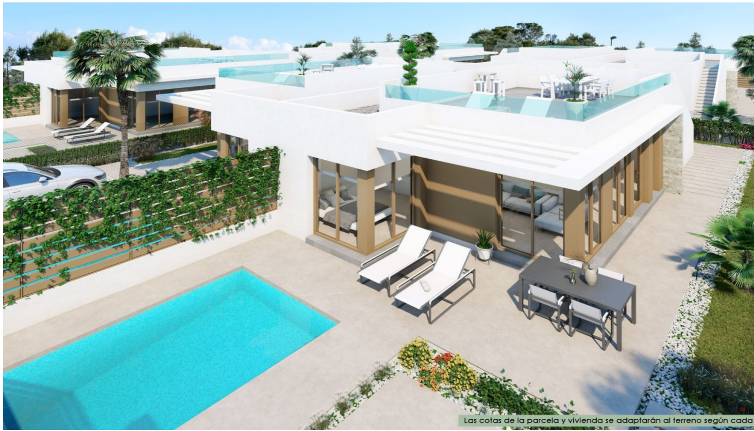
Las cotas de la parcela y vivienda se adaptarán al terreno según cada