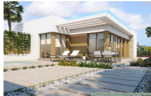
Las cotas de la parcela y vivienda se adaptarán al terreno según cada